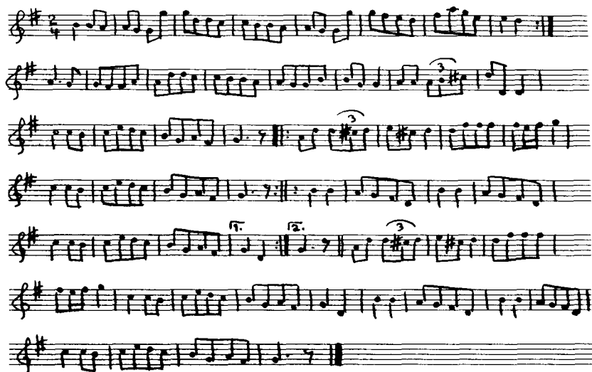
Ex. 4b: "Den ny Maskerade" fra Thy, Foreningen til Folkedansens Fremme: Gamle Danse fra Mors og Thy (2/ København 1949), s. 74-75 (HU DaFo nr. 402)