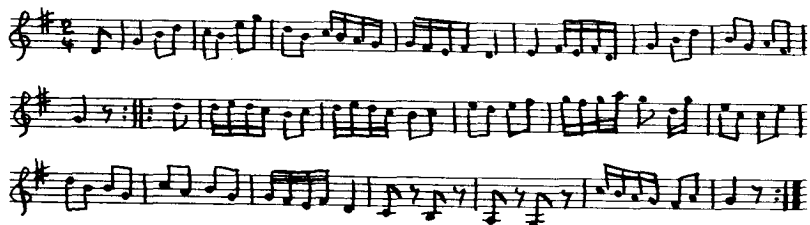
Ex. 3: "Hexedans" fra Jærdelund v. Flensborg efter Berggreen (Bg DaFoM nr. 274, s. 333 og note s. 378).